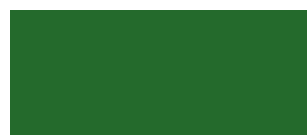
VERDE EGEO 156