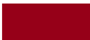
ROSSO CARMINIO 116