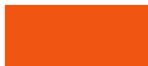
ARANCIONE PURO 114