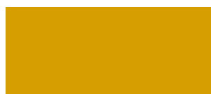
GIALLO OCRA 145