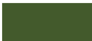
VERDE OLIVA 143