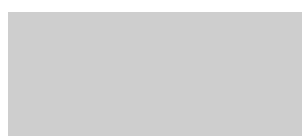
GRIGIO PERLA 140