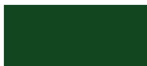
VERDE BOSCO 128