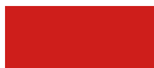
ROSSO SEGNALE 115