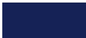
BLU OLTREMARE 135