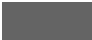
GRIGIO TORTORA 123